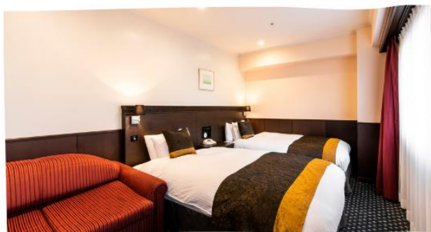
デラックスツインルーム