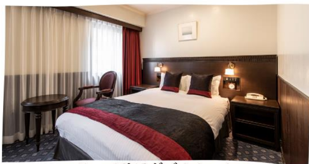
スーパーリアダブルルーム