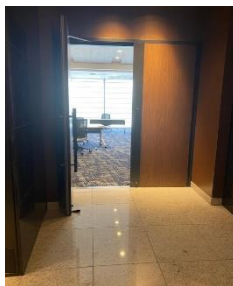
お客様とご相談の上、開放させていただきます。その場合は他のお客様がフロアに入らぬよう調整させていただきます。