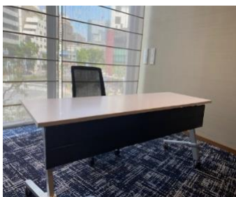
幅180cmテーブルに1名掛けゆったりご利用いただけます。