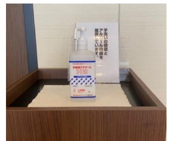
会場入口と会場内にご用意させていただきます。